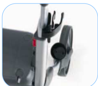
Beslag til stok