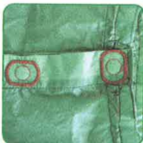
Modsat placeret magnet for mere styrke