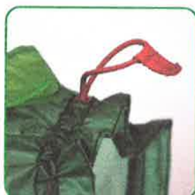
Indsyet elastisk snor til trækkeffekt