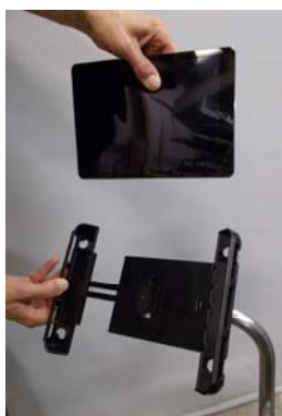
Træk ud i fjedregrebet