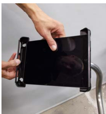
Træk ud i fjedregrebet