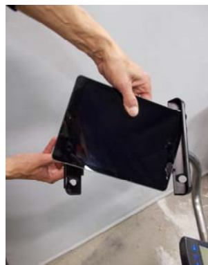
Fjern tabletten og slip fjedregrebet