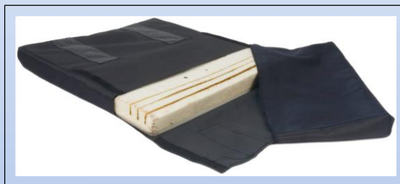
P3b. Siddepude med åbent betræk og pre-cut skum til dybdeindstilling

Universal kørestolspude af koldskum med sort inkontinensbetræk. Justerbar siddedybde. Betrækket er udstyret med velcro og kan let åbnes. Puden er lavet af koldskum, og er udstyret med riller for dybdejustering af puden. Skummet skæres til den ønskede dybde. Med velcro kan betrækket lukkes til den valgte dybde. Puden leveres som standard med vores kørestol "Dolphin".