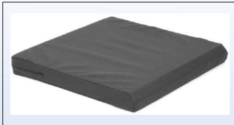
P2a. Kørestolspude med inkontinensbetræk