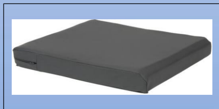
P4a. Pude med inkontinensbetræk