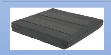
P4b. Underside med skridsikker belægning