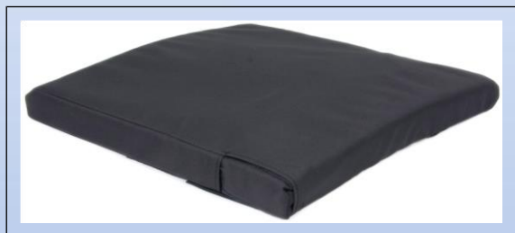
P3a. Universal pude med inkontinensbetræk