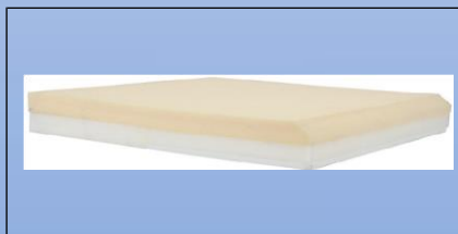
P4c. Viskoelastisk + PU skum

Kørestolspuden er opbygget med et lag viskoelastisk skum øverst og en almindelig koldskum nederst. Leveres komplet med inkontinensbetræk, og skridsikker underside.