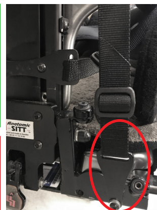
Eksempel på montering med nedre beslag Zitzi Delfi/ Sharky Pro

Thoraxselen er et positioneringshjælpemiddel for funktionshæmmede og bør bruges sammen med et hoftebælte. Læs hele brugervejledningen før brug.