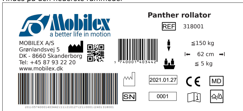
Billede af typeskilt for 318001