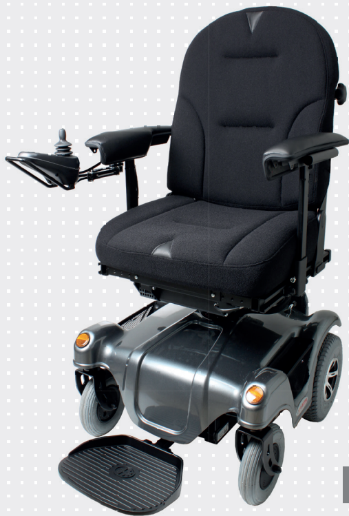
VELA Blues 300

VARIANT: Kombineret forhjuls- og baghjulstræk