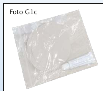
Lappegrej til madras B01

Madrassen leveres komplet med den justerbar pumpe.