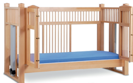
høj seng OLAF 98 natur 200/90