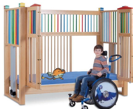
høj seng OLAF 135 farve 200/90