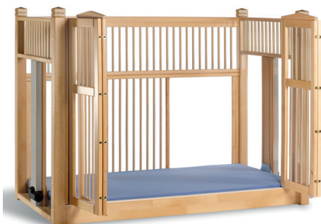
høj seng OLAF 135 natur 200/90 (17 cm indstigning)