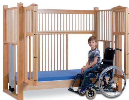
høj seng OLAF 98 natur