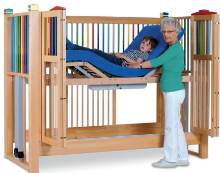
høj seng OLAF 98 farve 200/90