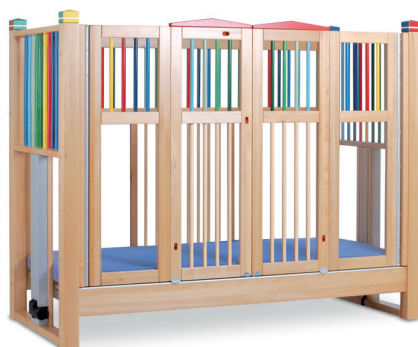
høj seng OLAF 135 farve 200/90