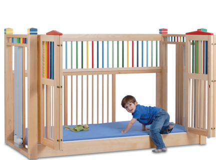
høj seng OLAF 98 farve 200/90 (17 cm indstigning)