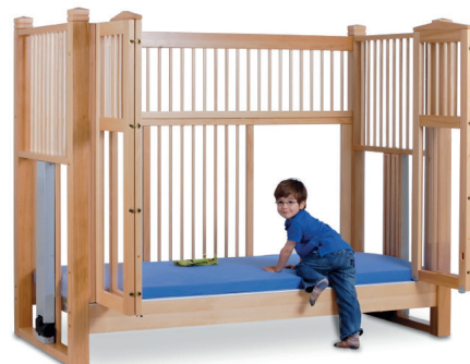
høj seng OLAF 98 natur 200/90