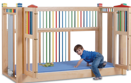
høj seng OLAF 98 farve 200/90 (17 cm indstigning)