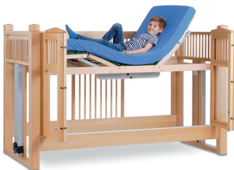
høj seng OLAF 98 natur 200/90