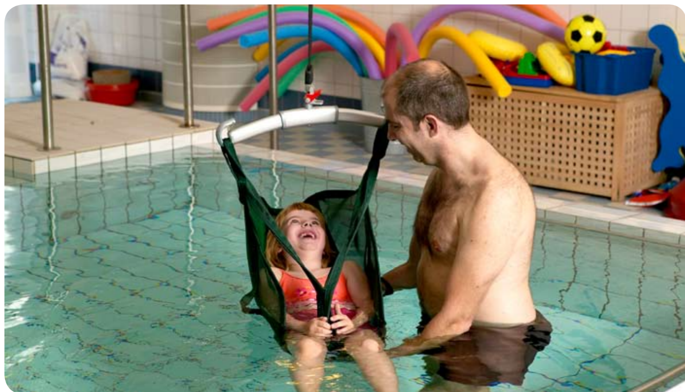
Liko tilbyder et antal forskellige løftesejl, som er hensigtsmæssige til bade- og brusesituationer. Billedet viser Børne originalsejl høj model 20 udformet i et åndbart, plastbelagt netmateriale.