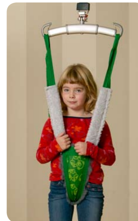
Børne løftebuks model 92

Størrelser: model 64, XS (art.nr. 3564813)