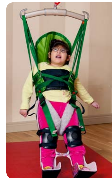
Børne ståskalsvest model 67

Anvendelsesområde: Børne ståskalsvest model 67 har vi udviklet med henblik på det svære løft af et barn i ståskal fra gulvniveau op til stående. Liftet optager hele vægten, og barnet løftes trygt med bekvem støtte for hele kroppen og hovedet.