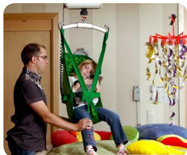
Børnesejl høj model 26 er én af vores almindeligste modeller. Tryk, komfortabel og sikker.