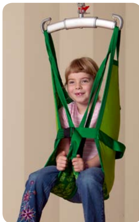
Børne originalejl lav model 10

Anvendelsesområde: Børne originalejl lav passer til løft til og fra siddende/halvsiddende eller gulv, hvis barnet ikke har brug for særskilt støtte af hovedet.