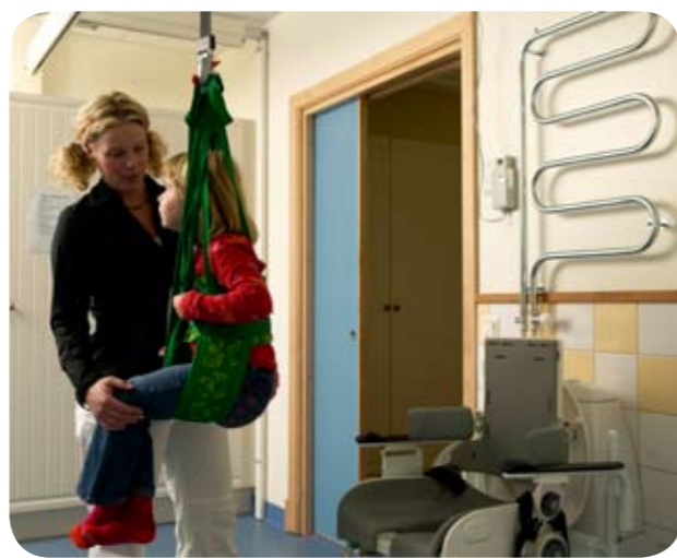
Til toiletbesøg har vi flere forskellige alternativer. Billedet viser Børne hygiejnesejl lav model 50, som gør det muligt at trække bukserne ned, når barnet er løftet op i løftesejlet.