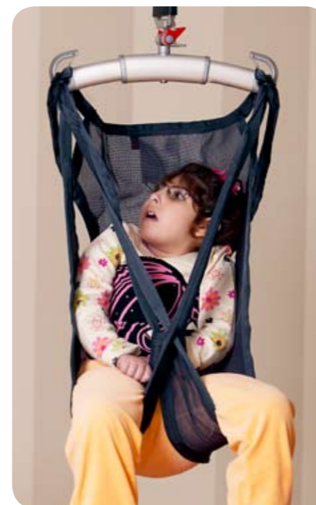
Børne skalsejl original model 22

Størrelser: XS (art.nr. 3526813) S (art.nr. 3526814)