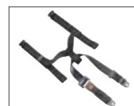
Sikkerhedssele inklusiv hoftebælte**