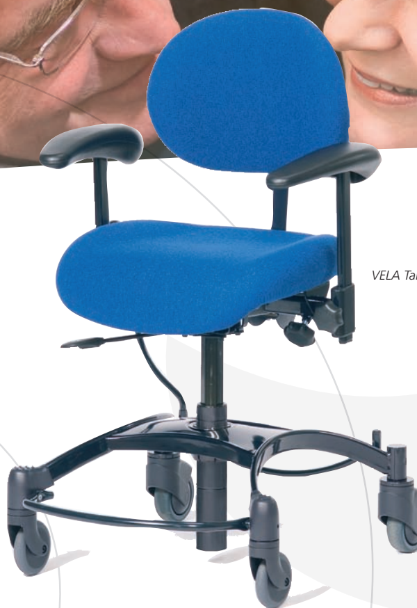
VELA Tango 100

VELA Tango-serien er designet til det aktive menneske til brug i hjemmet eller på arbejdspladsen. Designet er let og enkelt og med tanke på at skulle fylde mindst muligt.