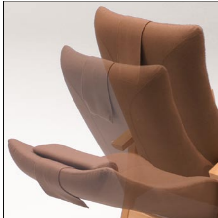
Regulering af ryg

Al teknik er skjult i den stærke konstruktion. Selv fodstøtten er elegant pakket ind under sædet, når den ikke er i brug.