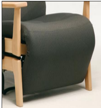
Også med lang fodhviler