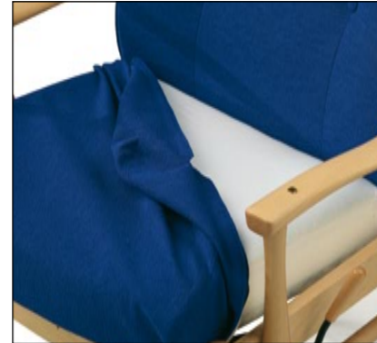
Aftageligt betræk 0720