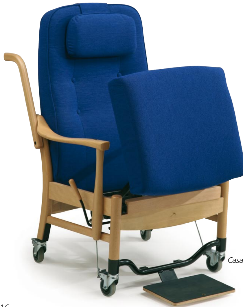
Casa Mobil 5290

Hjulene er robuste nok til både at passere gulvtæpper og dørtrin, og din hjælper kan styre stolen med kørehåndtagene, mens du blot hviler fødderne på pladen.