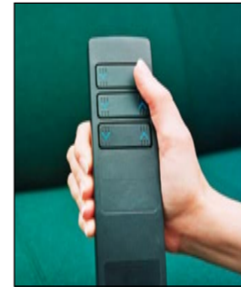
Elektriske funktioner som er lette at betjene