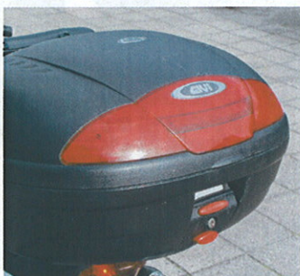
Stor aflåselig boks med god opbevaringsplads fås som tilbehør i 2 str.