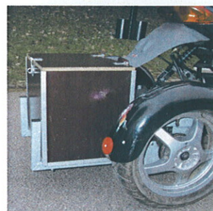
Kasse med bøjle - galvaniseret