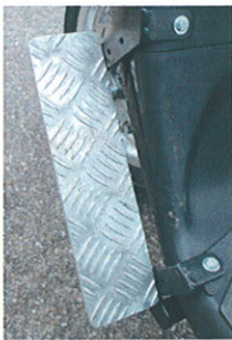
Benstøtteholder for stift ben -