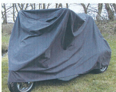
Vind- og vandtæt garage til Atlantis i 2 modeller.