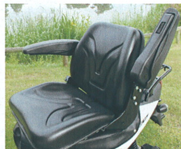
Komfortsæde med armlæn, justerbar ryghældning og af-fjedring. Sædehøjde fra 75 cm