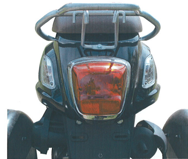
Tydelige bag- og blinklys. Kraftig bagagebærer.