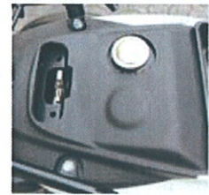
Påfyldning af benzin. Aflåst tank under sædet.