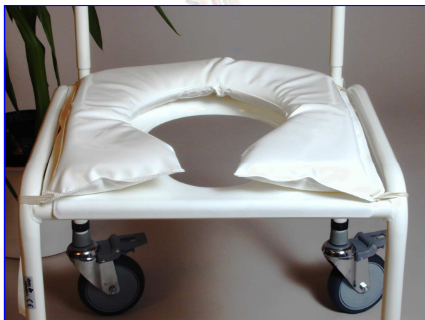
TOILETSTOLSPUDE (HMI-Nr. 01858)

Alle støttehåndtagene har en dybde (til væggen) på 4.5 cm.