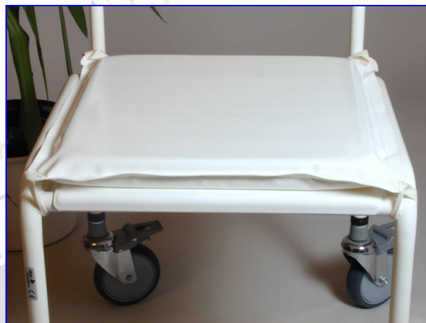
STOLEPUDE (HMI-nr. 12370)

Puderne tåler både urin og ikke-ætsende rengøringsmidler. Hvert hjørne har to bomuldsbændler til fastspænding. Toiletudskæringen på toiletstolspuden er oval og med åben front - ca. 22 x 32 cm (b x d).