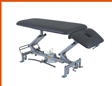
Follo Corpus Masolett, 2 puter (113-119100-P)