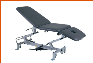
Follo Corpus Masolett, 3 puter (113-119200-B)