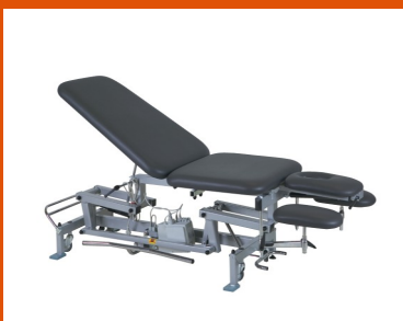
Follo Corpus Masolett, 5 puter (113-119100-C)