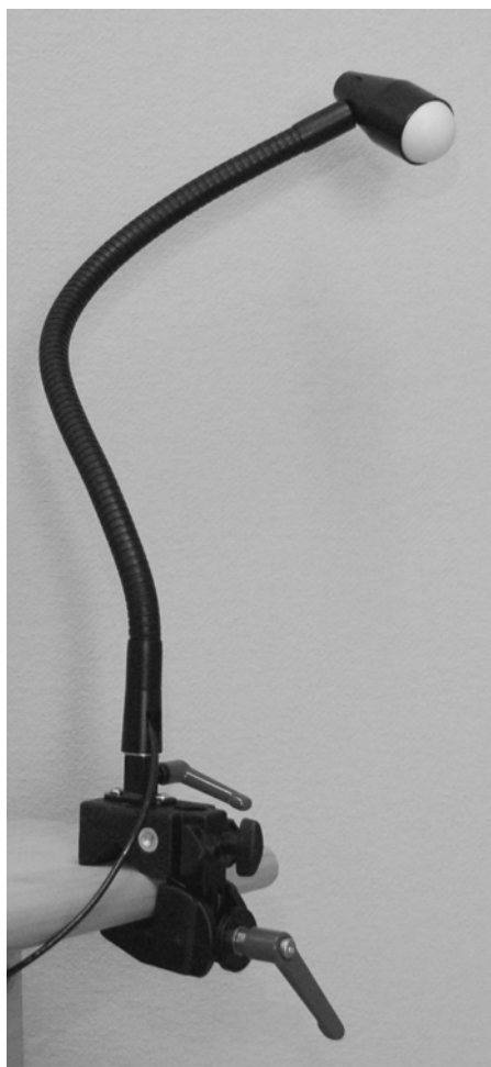
Flexarm på Superclamp, indvendig kabel kontakt monteret i 70°