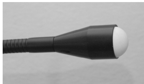
Lige monteret tennisboldkontakt.