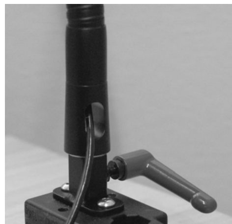
Ledning ført inde i flexarm.