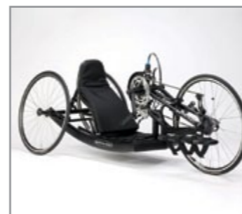
Antaras A: Justerbar håndcykel til siddende eller liggende kørestilling