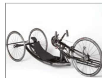
RaceBike: Skræddersyet til konkurrencebrug. Liggende kørestilling