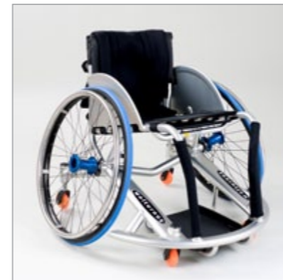
Basket: Skræddersyet basketkørestol