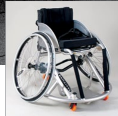
Basket A: Justerbar basketkørestol. Justerbart sæde, balance og fodstøtter