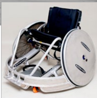
Rugby Attack: Sidevingerne er forstærket for at modstå hårde tacklinger.

Rugbykørestolene er designet og produceret i Danmark. De skræddersyes til den enkelte bruger og rammens geometri tilpasses din styrke, størrelse og position på banen.