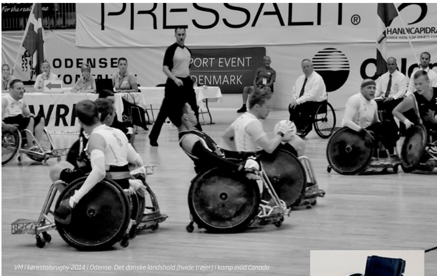
VM i kørestolsrugby 2014 i Odense. Det danske landshold (hvide trøjer) i kamp mod Canada