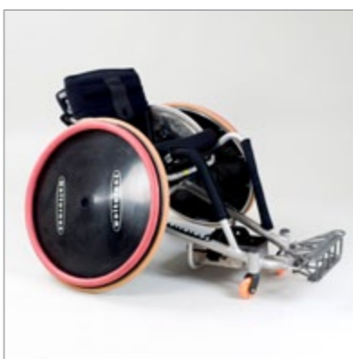
Rugby Defence: Den lange forende er designet til at fastholde og blokere modstanderens kørestol.