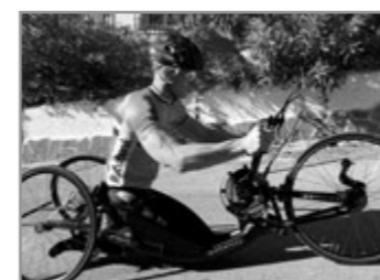
Racebike K: Skræddersyet håndcykel til konkurrencebrug. Knælende kørestilling eller til benamputerede med fuld funktion i overkroppen.