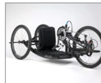
Antaras Off-Road: Justerbar håndcykel til liggende eller siddende kørestilling. Terrængående med MTB 559 hjul og dæk.