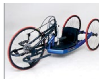
Antaras Junior: Justerbar håndcykel til børn og unge. Liggende eller siddende kørestilling