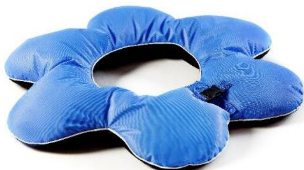
Badeblomst, S Str. 68x20 cm HMI: 72594