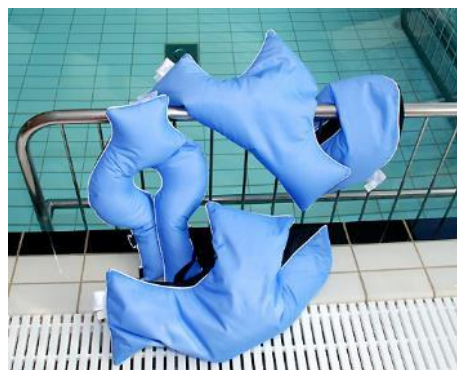
Halsflydekrave, T-formet flydepude og bananformet flydepude.

Flydepuderne kan ved behov maskinvaskes på 60°C. Flere af flydepuderne (fx bananformet flydepude i str. M og L) er så store, at de kræver vask i en industrivaskemaskine.