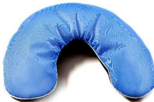
U-formet flydepude Str. 55x19 cm HMI: 64986