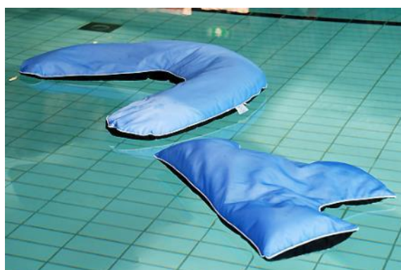
T-formet flydepude og bananformet flydepude.