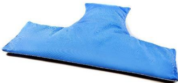
T-formet flydepude, S Str. 63x39 cm HMI: 64984

Størrelser angivet i længde x bredde x halshul