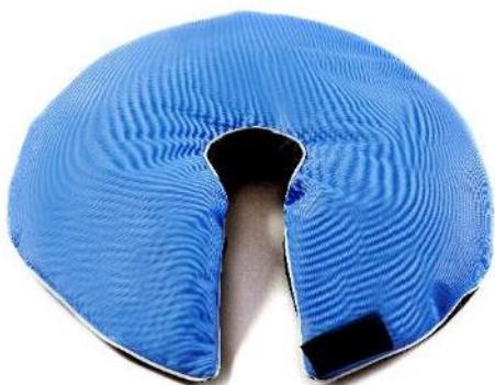
Nakkeflydekrave, S Str. 41x41x26 cm HMI: 70141