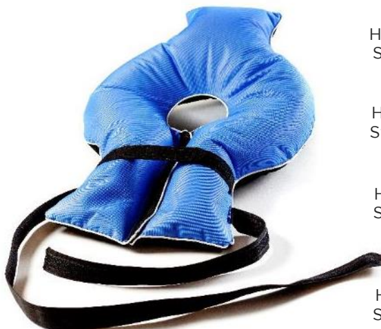
Halsflydekrave, XS Str. 50x34x23 cm HMI: 64990