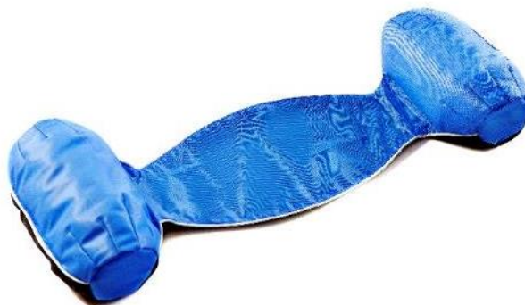
Flydestabilisator, S Str. 60-37x18-25 cm HMI: 72597