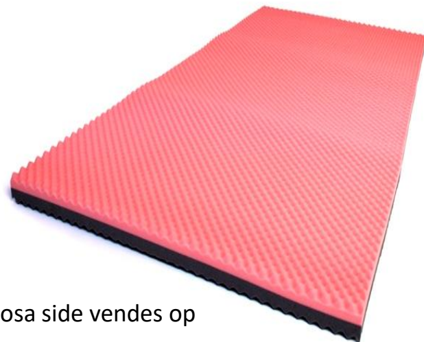
Rosa side vendes op