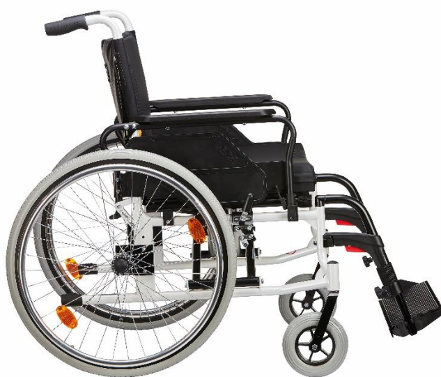
Caneo XL kørestol op til 200kg.

Cobi Rehab forbeholder sig retten til at ændre produktspecifikationerne uden forudgående varsel.