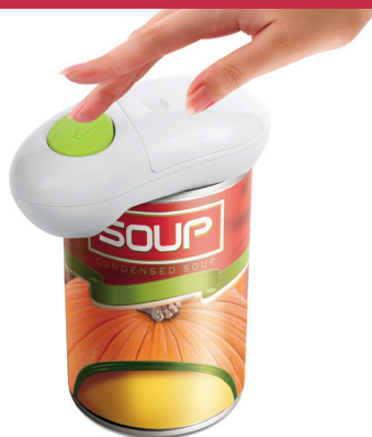
Elektrisk dåseåbner HMI nr. 112528

Vi tilbyder et stort udvalg af hjælpemidler til brug i køkkenet og ved spising. I vores udvalg indgår f.eks. ergonomiske køkkenknive til brød og kød, ergonomiske kartoffelskrællere, lågåbnere, smørebræt med høj kant, selvåbnende sakse mm. Vi tilbyder også ergonomisk bestik, tallerkener, krus, non-slip underlag og spisestykker.