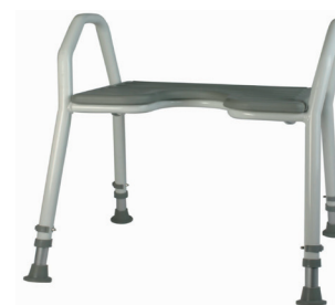
Badetaburet HMI nr. 46565