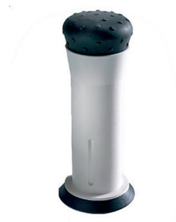
Karkludspreser HMI nr. 42399