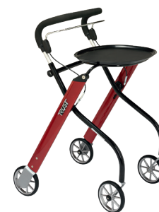
Indendørs TrustCare Let's go HMI nr. 43952