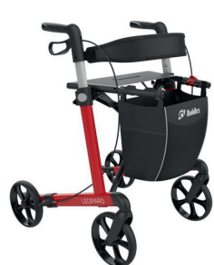
Mobilex Leopard HMI nr. 100690