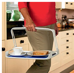
Bakke med håndtag HMI nr. 22399