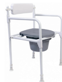
Toilet- og badestol HMI nr. 72620