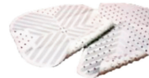
Bademåtte HMI nr. 106767