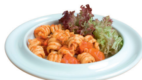
Tallerken med kant HMI nr. 106761