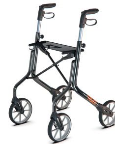
TrustCare Let's move HMI nr. 128727