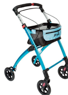
Indendørs Mobilex Jaguar HMI nr. 105546

Vi byder dig indenfor i Danmarks største rollator center. Vi tilbyder et stort sortiment af topmoderne og smarte rollatorer, som alle er udført efter de højeste kvalitetsstandarder. De fleste af rollatorerne er letvægtsrollatorer, der let kan foldes sammen, så de er nemme at have med på farten.