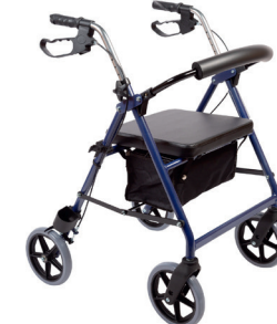
Mobilex Impala HMI nr. 69842