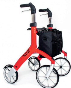
TrustCare Let's Fly HMI nr. 103628