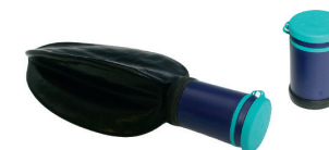
Sammenfoldelig urinpose HMI nr. 41845