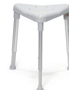
Trekantet badetaburet HMI nr. 44468