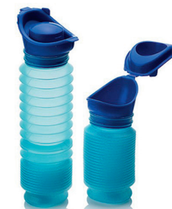
Urinflaske HMI nr. 81020