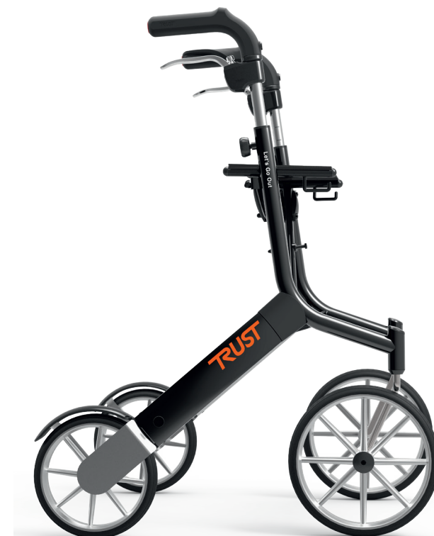
TrustCare Let's go out HMI nr. 70956