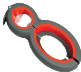
Multiåbner 6 i 1 HMI nr. 89418