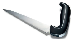
Ergonomisk brødkniv med takker HMI nr. 26459