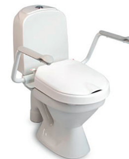
Toiletforhøjer HMI nr. 16096