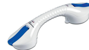
Greb med sugekop HMI nr. 121189