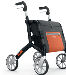
TrustCare Let's shop HMI nr. 119760