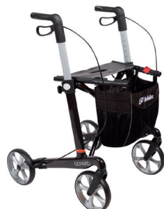
Mobilex Gepard HMI nr. 89435