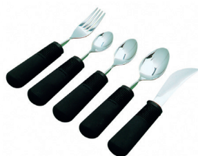
Good Grip bestik HMI nr. 21896