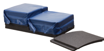
Vandcelle og skumindlæg