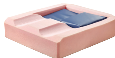
Højden på vandcellerne er individuelt regulérbar ved hjælp af skumindlæg