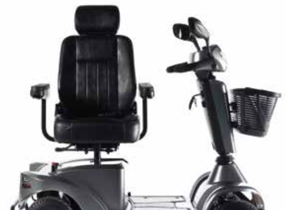
→ Sæderotation muliggør komfortable forflytninger