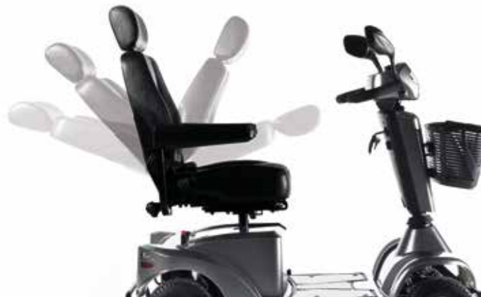
→ Hurtig justering af ryglænets vinkel