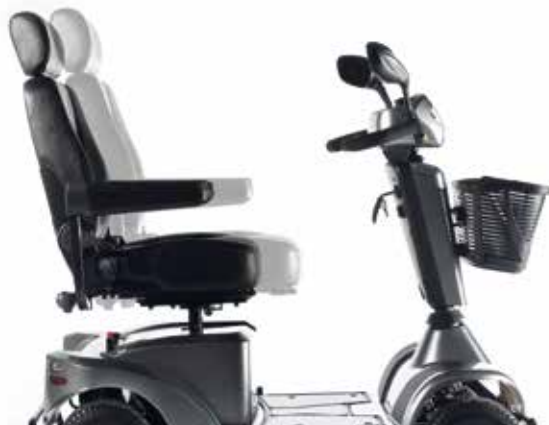
→ Ubegrænset sædedybdejustering

Den avancerede sædeløsning i S-SERIEN tager komfort til det højeste niveau. Fra justerbar sædehøjde, sædedybde og tilbagelægning, til bredde-, vinkel- og dybdejusterbare komfortarmlæn – hver funktion er designet til komfort – til dig.