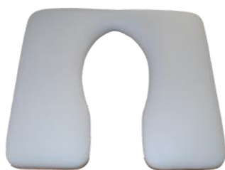
SÆDE M/SMALT HUL, nøglehulsudskæring