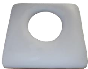
LANGT SÆDE m/ovalt hul, lukket front