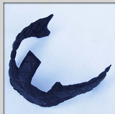
124 udskiftelige inderpolster (Sort)