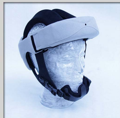
122 individuel kindbeskyttelse