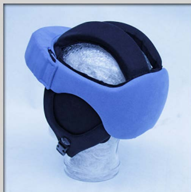
121 Ørebeskyttelse (Blå)

Derudover har vi udviklet indvendige dørklæder, der er lavet af et andet materiale, som f.eks. bomuld eller uld. Dette giver dig en ekstra beskyttelse mod UV-stråling, og det er også muligt at have en indvendig dørklæde, der er lavet af et andet materiale, som f.eks. bomuld eller uld.