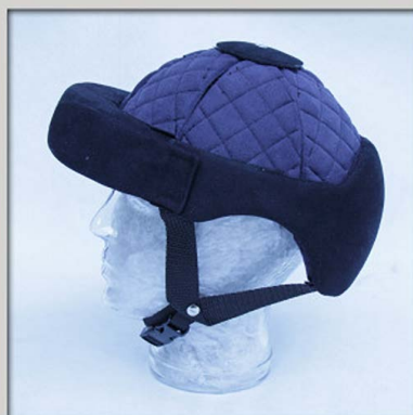
123 lukket Hovedtop (Sort)