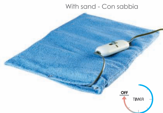
With sand - Con sabbia

Con Sabbia Controllo elettronico della temperatura Sistema di sicurezza Sistema di Auto-spegnimento 3 livelli di temperatura Rivestimento impermeabile Fodera separabile e lavabile in lavatrice