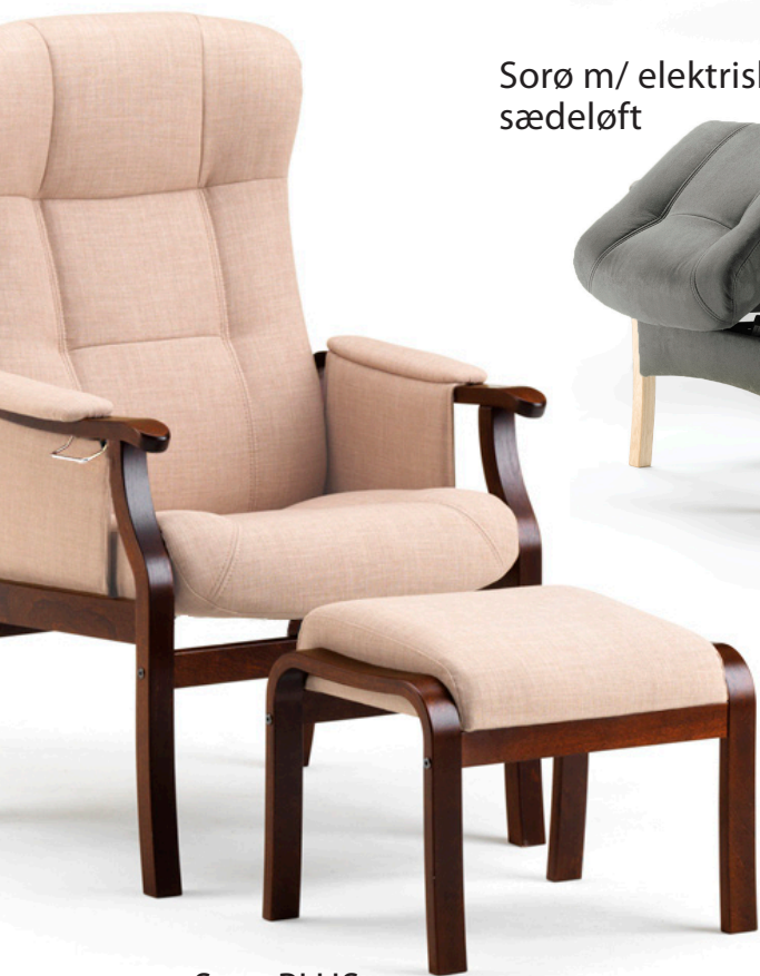
Sorø PLUS Fås i både small/42 cm og medium/47 cm

De bedst sælgende Sorø stole leveret fra uge til uge