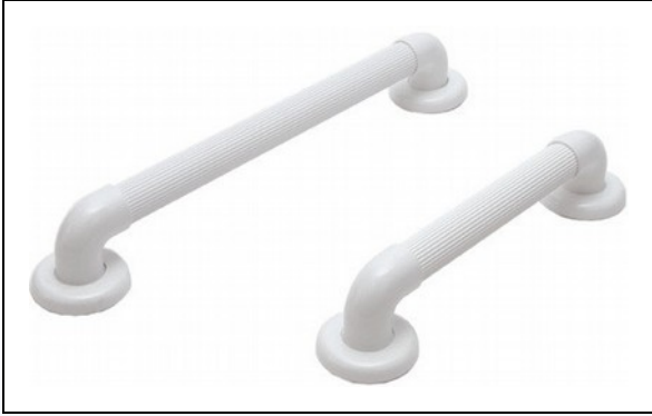
N1. Støttegreb i hvid PVC