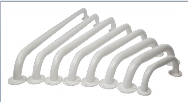
N3. Stålgrebene med Rilsan® belægning

Stålgreb kan leveres i længderne 16 cm, 25 cm, 30 cm, 40 cm, 50 cm, 60 cm, 75 cm og 90 cm