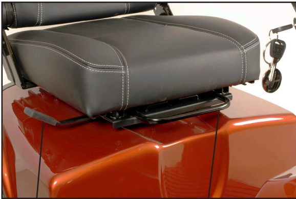
Udløserhåndtag for sædedrej. Udløserhåndtag for sæde frem/tilbage.

Andre sæder, som kan leveres til Mini Crosser er opbygget efter samme princip. Udløserhåndtaget er som standard monteret i højre side, kan efter ønske monteres i venstre side.