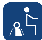
Max brugervægt ▼