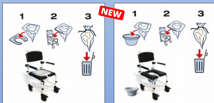
OY10. Commode Liner Disc

Die Hygiene Tüten sind mit Plastik Sitzauflage (Bild OY10) oder ohne (Bild OY11) erhältlich.