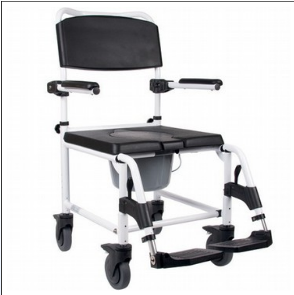
OY1. Alu Dusch- und Toilettenrollstuhl "Kakadu", serienmässig mit 5" Rädern