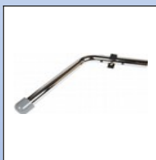
OY7. Kippschutz (Anti-tip) ACHTUNG: ist nur mit 24" Rädern montierbar!