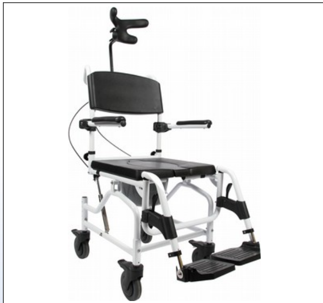
OY3. Alu Dusch- und Toilettenrollstuhl "Kakadu Tilt"