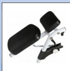
OY5. Amputationsstütze, höhenverstellbar

Für die Dusch- und Toilettenrollstühle der Serie "Kakadu" ist verschiedenes Zubehör verfügbar.