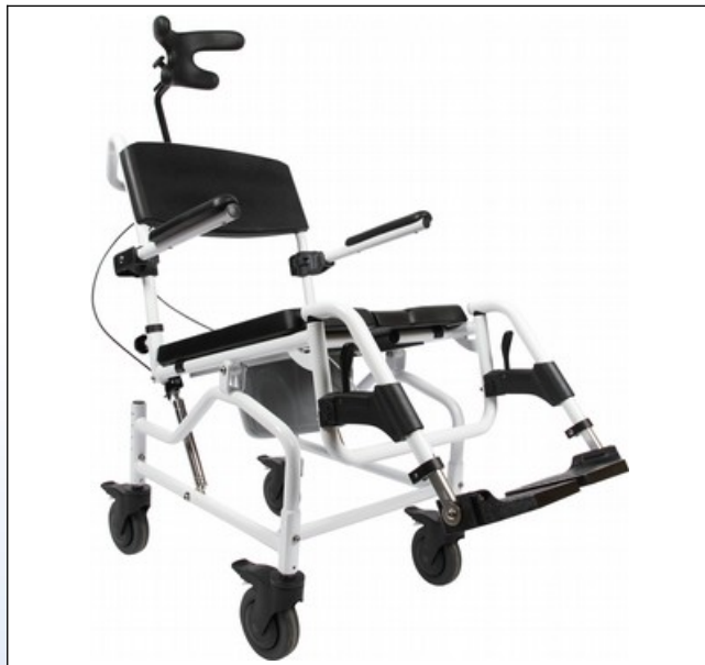
OY4. Alu Dusch- und Toilettenrollstuhl "Kakadu Tilt" in gekipptem Zustand

Der Dusch- und Toilettenrollstuhl " Kakadu Tilt " kann in der Sitzkantelung individuell von -5^\circ bis +25^\circ eingestellt werden. Die Kopfstütze mit Ohrenaussparung kann in der Höhe, Tiefe und im Winkel verstellt werden und ist im Lieferumfang enthalten. Die Unterschenkelänge und der Winkel der Fußplatten sind bei den Fußstützen verstellbar. Die komplette schwarze Polsterung inklusiv der Kopfstütze besteht aus weichem PUR.