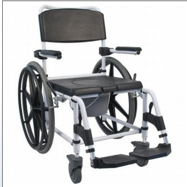
OY2. Alu Dusch- und Toilettenrollstuhl "Kakadu" mit montierten 24" Hinterrädern (optional)

Der Dusch- und Toilettenrollstuhl " Kakadu " hat einen Rahmen aus weiß eloxiertem Aluminium und wird standardmässig mit vier 5" Rädern mit Feststellbremsen ausgeliefert. Der Sitz, der Rücken und die klappbaren Armlehnen bestehen aus schwarzem weichem PUR. Die Fußstützen sind höhenverstellbar und abnehmbar. Der Stuhl wird serienmässig mit WC-Eimer, -Deckel und schwarzer Sitz-Abdeckung geliefert.