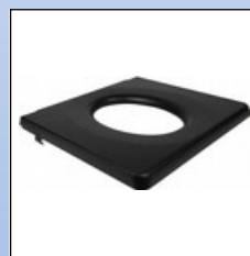
OY8. Sitz-Abdeckung mit rundem Loch