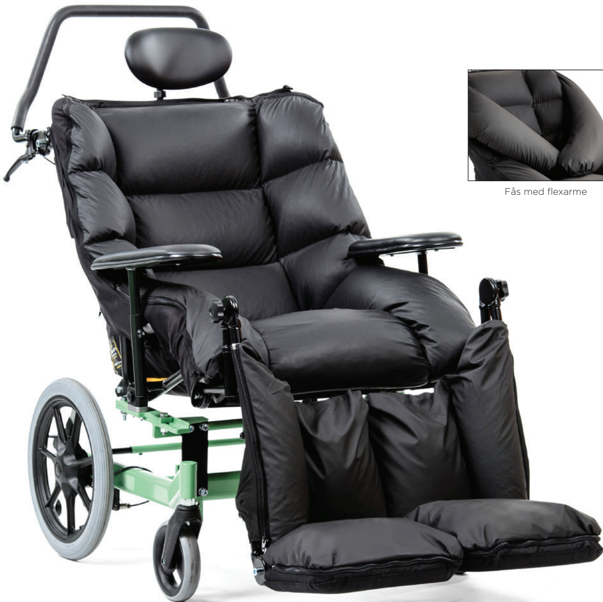
Fås med flexarme

Opnå naturlig ro og tryghed hos urolige brugere med gyngestolens stimulering af den vestibulære sans.