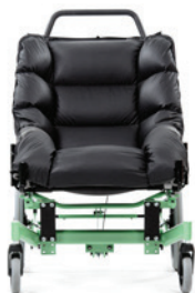
Swing forfra uden læg- og fodpuder