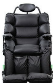
Swing forfra med flexarme