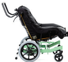
Swing fra siden uden læg- og fodpuder