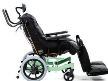
Swing fra siden uden flexarme