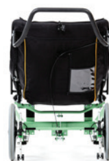
Swing bagfra uden nakkestøtte, læg- og fodpuder