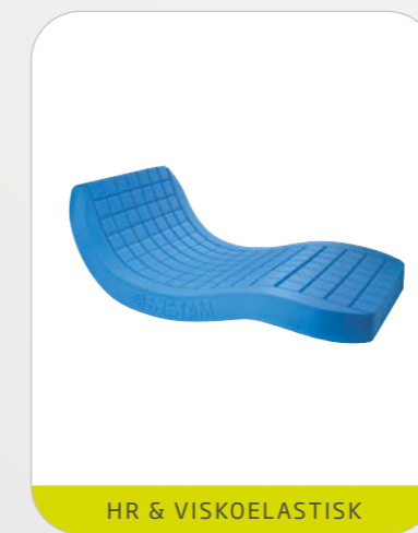
HR & VISKOELASTISK