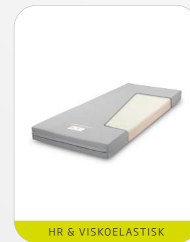
HR & VISKOELASTISK