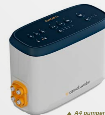
▲ A4 pumpe