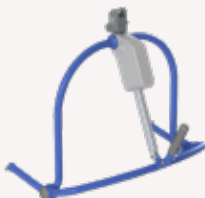
Medium og stor 4-punkts Powered Dynamic Positioning System