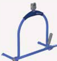
Manuel 4-punkts Dynamic Positioning System