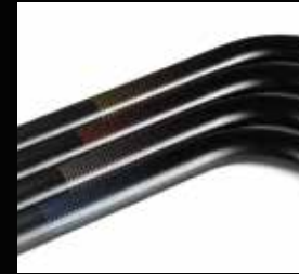
Ramme grafik Flydende prikkesdesign