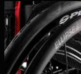
Håndringe, Ellipse 3R, sort