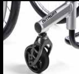
Svindhjuls gaffler, Carbotecture®