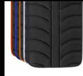
Exo Pro ryglæn