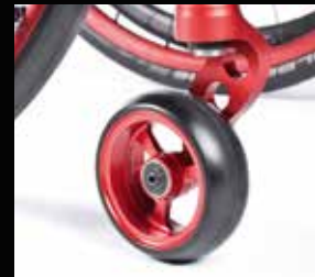
Svindhjuls gaffler, aluminium, én-arm

Benyt din egen visualisering til at lave din egen favorit Nitrum!