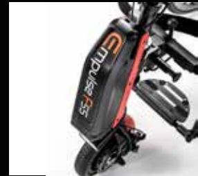
Mulighed for tilkobling til Empulse F55