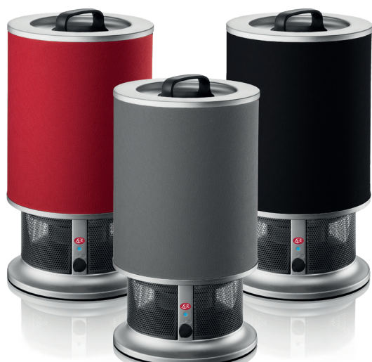
AeroGuard Mini Den effektive luftrensere til mindre rum

3D Zyme Bakteriel spray, der fjerner årsagen til dårlig lugt.