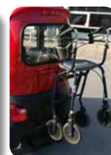
Holder til rollator eller kørestol