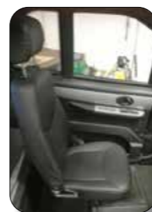
Sædeflytning for ekstra benplads

Se ekstraudstyr og priser på www.kabinescooter.dk