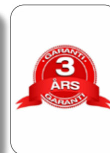
3 års garanti