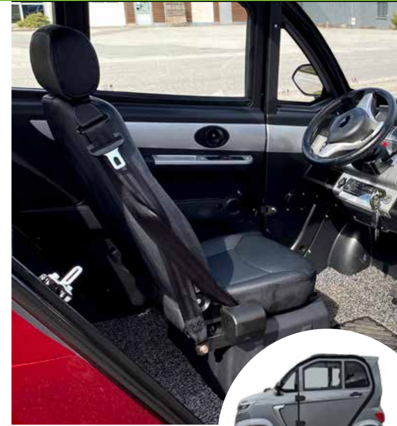
BACH 27 m/4 hjul