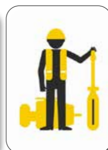
Serviceabonnement - undgå uforudsete omkostninger