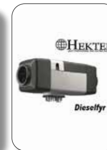
Oliefyrt eller opgrad. af varmesystem