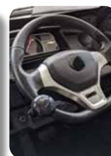
Ratknop for betjening med én hånd