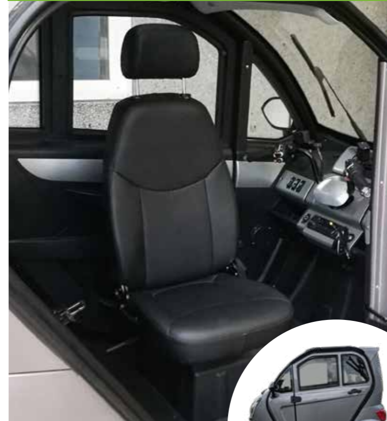
BACH delux 26 m/3 hjul

Bevægelsesfrihed, fleksibilitet, tryghed og selvstændighed - året rundt