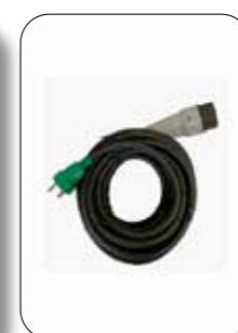
Ekstra lang ladekabel