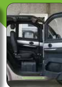
Ekstra bred døråbning