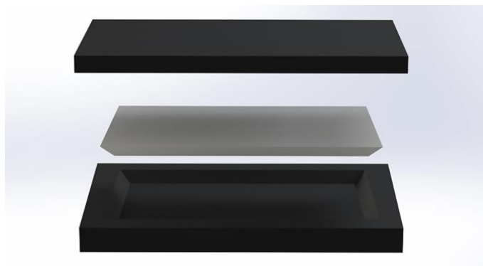
Siddepuden består af tre forskellige slags skum.

Benstøtter kan fjernes uden brug af værktøj og påvirker ikke stabilitet.