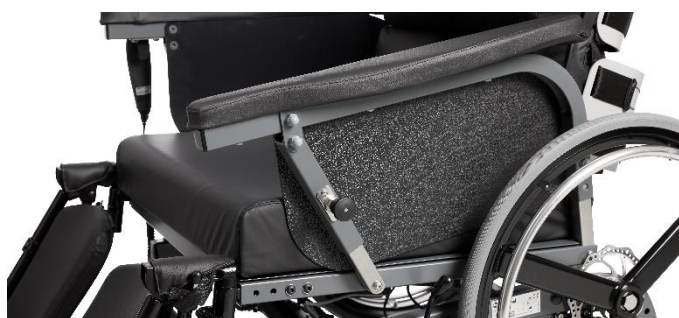
Svingbare armlæn tillader placering tæt på bord.