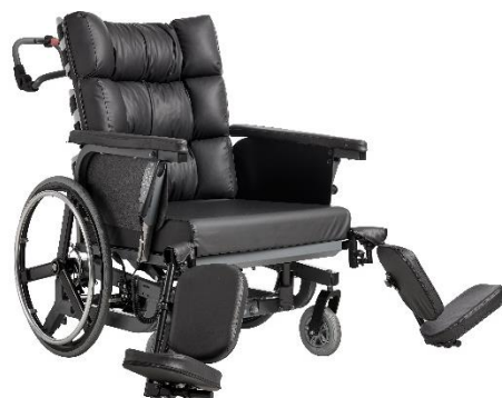
Benstøtter, der kan bære op til 200 kg hver.