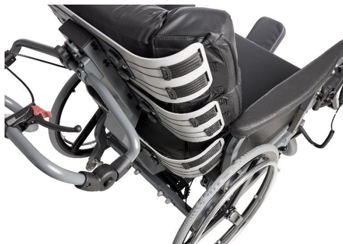
Buede rygplader, der støtter og omfavner brugeren fra bagdel til nakke.

Kørestolens ryg består af et højstyrkestål profil. Profilet er centreret på kørestolens ryg. Vinklingen på profilet gør, at ryggen både støtter den æbleformede og den pæreformede bruger. På profilet er der påmonteret tre rygplader. Rygpladerne er buet for at kunne omfavne og støtte brugeren fra bagdel til nakke.