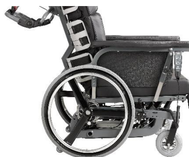
Benstøtterne kan afmonteres uden brug af værktøj.