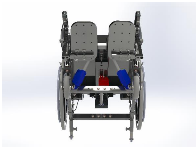
To aktuatorer (markeret med blåt) styrer tilt funktionen. Én aktuator (rød) styrer recline.