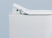
SensoWash® Slim — 22