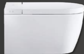
— SensoWash® Starck f Plus # 650000 — SensoWash® Starck f Lite # 650001

— Duravit y Philippe Starck presentan con SensoWash® Starck f una nueva generación de asientos de lavado para una higiene moderna y natural. Para ello, todos los componentes se han optimizado y toda la tecnología queda oculta en el interior del cuerpo de la cerámica. El asiento plano y el recubrimiento posterior en blanco forman una unidad armónica y precisa. Un asiento de lavado con tecnología de última generación aporta confort y un aspecto purista sin concesiones. Disponible en la versión SensoWash® Starck f Plus y SensoWash® Starck f Lite.