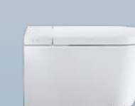
SensoWash® Starck f — 10

Naturalmente limpio y fresco. No hay una limpieza más a fondo, más higiénica, más natural y más refrescante que la realizada con agua. Incluso después de ir al baño. Por eso, el asiento de lavado, la síntesis de inodoro y bidé, resulta cada vez más popular. El agua brinda una placentera sensación de frescura y es más suave y más agradable que el papel higiénico. Así, tras usar el asiento de lavado, permanece en el usuario una sensación de limpieza y agradable vitalidad. Con SensoWash®, Duravit aporta un programa innovador y sofisticado de asientos de lavado que satisfacen las necesidades modernas de limpieza higiénica y elevado confort de manejo.