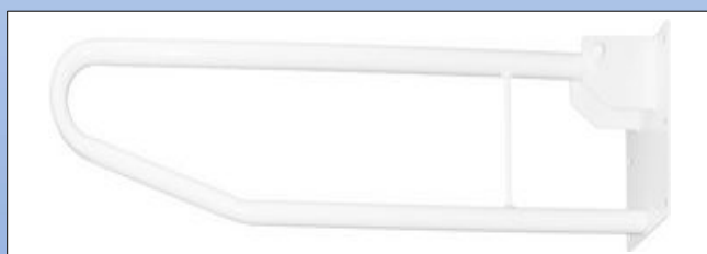
N3. Klapbart støttegreb til vægmontage

Klapbart toiletstøttegreb af pulverlakeret stål, monteres f.eks. på væggen bag toilet.