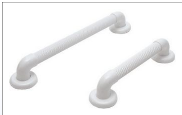
N1. Støttegreb i hvid PVC