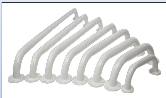
N3. Stålgrebene med Rilsan® belægning

Stålgreb kan leveres i længderne 16 cm, 25 cm, 30 cm, 40 cm, 50 cm, 60 cm, 75 cm og 90 cm. Grebene har en tykkelse på 25 mm (16 cm dog 20 mm). Kan belastes med op til 200 kg, afhængig af væggens beskaffenhed.