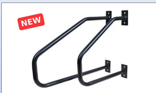
N5. Sort pulverlakeret støttegrebene af stål

Stålgreb kan leveres i længderne 16 cm, 25 cm, 30 cm, 40 cm, 50 cm, 60 cm, 75 cm og 90 cm. Grebene har en tykkelse på 25 mm (16 cm dog 20 mm). Kan belastes med op til 200 kg, afhængig af væggens beskaffenhed.