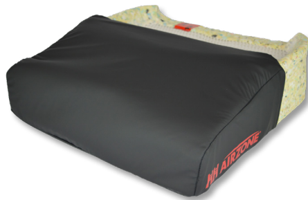
LowZone Gel2 Contour