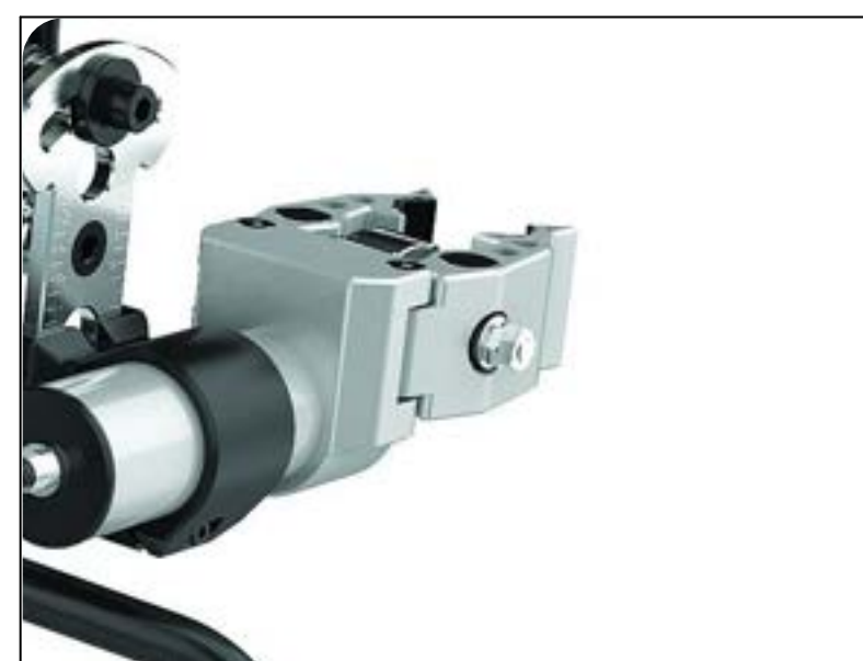
Automatiske clamps for montering uden brug af håndkraft