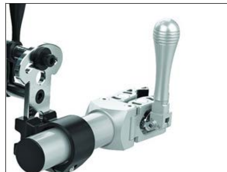
Manuelle clamps med lange klemmer for nem montering

Automatiske clamps aktiveres ved tryk på knap på styret og er særligt velegnet til brugere med nedsat funktion i arme eller hænder. Automatiske clamps sikrer den rette køreposition uden brug af kræfter.