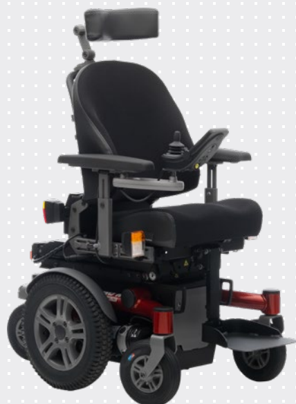
VELA Sango Slimline Jr. MWD

VARIANT: Forhjulstræk, Baghjulstræk, Centerdrev