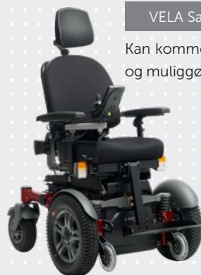
VELA Sango Slimline Jr. FWD

Kan komme rundt på smalle steder og muliggør 90° vinkling af benene.