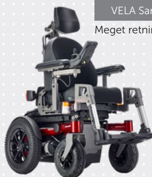
VELA Sango Slimline Jr. RWD

Drejer om sin egen akse, hvilket gør den nem at manøvrere på begrænset plads.