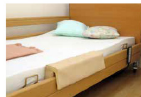
Forlængerpudder til at placere over sikkerhedssiden i fuld længde