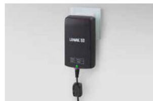
Electronic (SwitchMode) power forsyningsenhed integreret i netstikket