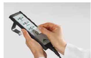
Fjernbetjening med selektiv låsefunktion