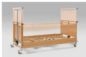
Justeringsområde fra 30-80 cm