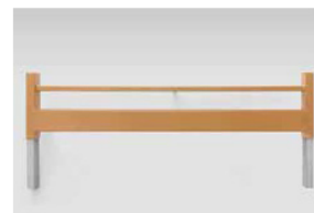
Sengeudvidelse (også til eftermontering)