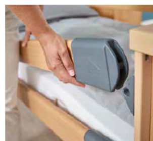
Værktøjsfri montering på sikkerhedssiden med Easy-Click system