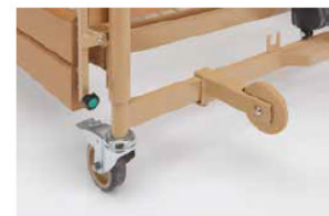
Vægfender rulle inkl. holder