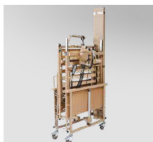
Kompakt levering og opbevaring - som vist på illustration