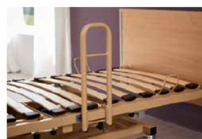
Forflytningshjælp fra siddende til stående