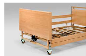
Træpaneler til at dække chassiset (også til eftermontering)