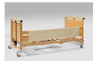
Sengehestbeskytter i skum og læder