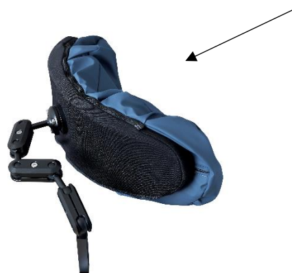
Armen på nakkestøtten består af udskiftelige, kraftige kugleled.

Der er påmonteret to pudeelementer på nakkestøtten, en blød skumbase betrukket med neopren og en blød pude med tre kamre fyldt med Krøyer-kugler og viskoelastisk skum. De enkelte kamre kan justeres efter behov.