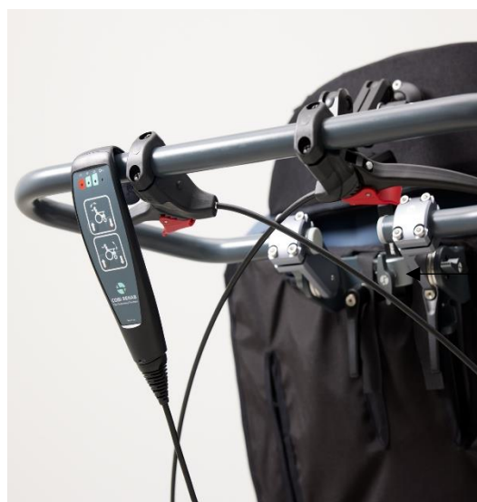
Skubbebøjlen monteres på beslagene, hvor fingerskruerne ses i siderne.

Bremsegrebene er monteret på skubbebøjlen. Grebene er udstyret med en lås, som kan låses op ved at holde bremsegrebet inde, mens den røde udløserknop trykkes ind.