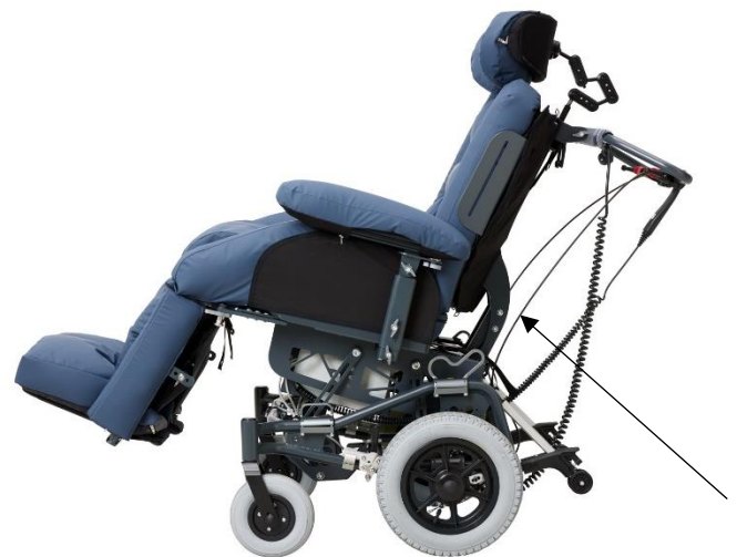
Konstruktionen på rygsystemet mindsker risikoen for shear ved ændring af ryg vinkel.

Rygforlænger (tilkøb) består af tre plader monteret på rygsystemet. Rygforlænger kan justeres asymmetrisk.