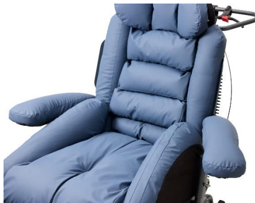
Swing away armlæn er standard på alle udgaver af Kamille Komfortkørestol.

Der kan tilkøbes krammearme med tyngde, som understøtter borgers arme og bidrager til yderligere tryghed, ro og komfort.