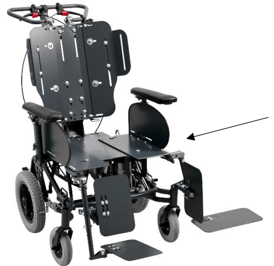
Selvstændige plader i sædesystemet sikrer en præcis indstilling.

Til forskel fra andre komfortkørestole, er størrelsen ikke fast, men et interval. På den måde kan bredde og dybde justeres til bedst muligt at imødekomme brugers dimensioner.