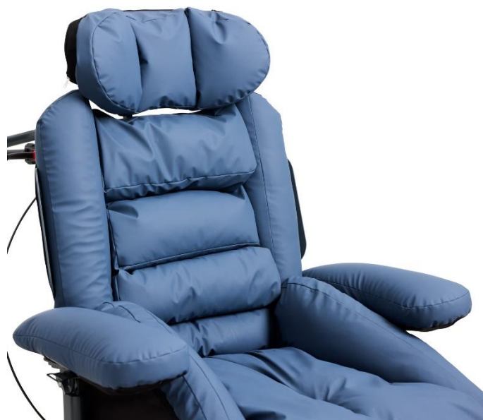
Puderne er modellerbare og kan justeres manuelt til den enkelte borger.

Puderne er nøje udformet til at passe den kropsdel, som de understøtter. Puderne er holdt i en neutral tone, da erfaring viser, at mørke farver kan virke "bundløse" for borgere med visuel-kognitive funktionsproblemer.