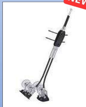
RBi2b. Komplet kablesæt for enhåndsbremse