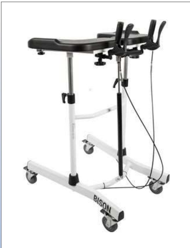
RBi1a. Bison gangbord