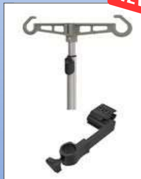
RBi2c. Drænposeholder eller dropstativ