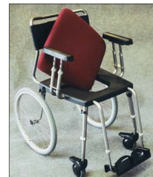
Store hjul, så man selv kan køre stolen