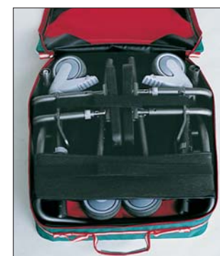
Nem at pakke i rejsetasken