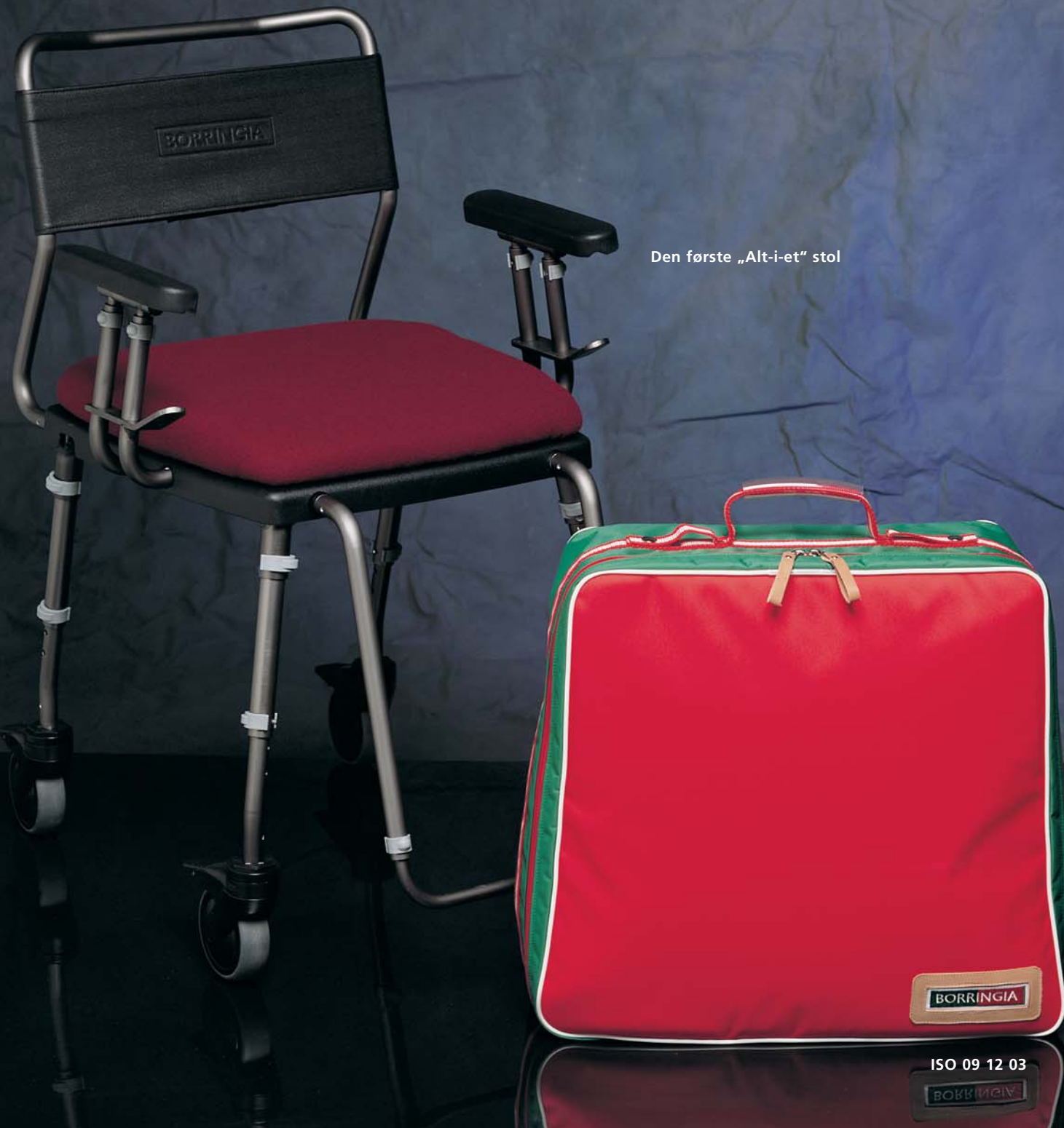
Den første „Alt-i-et“ stol