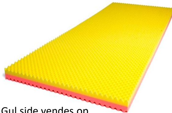
Gul side vendes op