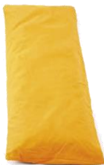
Firkantpude, Lang Str. 110x41x10 cm HMI: 27876 Varenr.: 0305-721-000