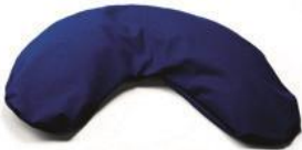
U-formet nakkepude, junior, S Str. 54/90x15x4 cm HMI: 6500, Varenr.: 0305-921-000