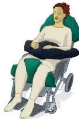
Tyk halvmånepude i skødet. Halvmånepude bag nakken. T-pude M mellem lårene.

Taktil stimulering hjælper og har en betydning for fx mennesker med demens, idet den afgrænsende fornemmelse af kroppen giver en beroligende effekt.