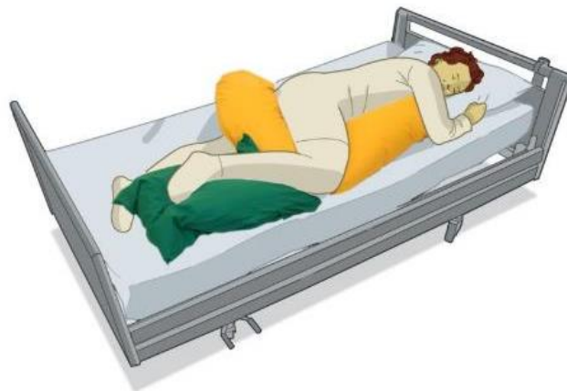
Bananpude L langs maven og mellem lårene. Firkantpude L mellem underbenene.

Bemærk, at Lasal lejringspuder ikke er et dokumenteret tryksårsforebyggende produkt, trods den høje komfort og trykfordeling.