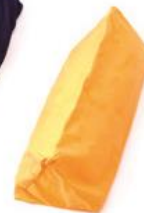
Trekantpude, M Str. 66x20x17,5 cm HMI: 27869 Varenr.: 0305-211-000