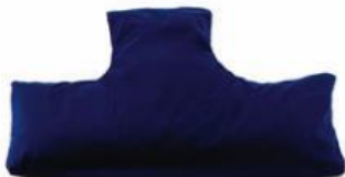
T-pude, L, Str. 83/27x56/27x10 cm HMI: 27885, Varenr.: 0305-6011-000