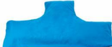
T-pude, XL, Str. 98/26x61/29x11 cm HMI: 27886, Varenr.: 0305-6001-000