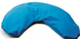
U-formet nakkepude, junior, L Str. 60/114x21x6 cm HMI: 65002, Varenr.: 0305-911-000