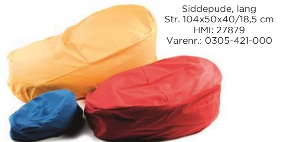
Siddepude, lang Str. 104x50x40/18,5 cm HMI: 27879 Varenr.: 0305-421-000