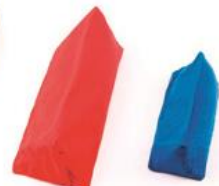
Trekantpude, S Str. 39,5x12x10 cm HMI: 27868 Varenr.: 0305-221-000