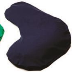
Halvmånepude, tyk Str. 86x40x7 cm HMI: 27871 Varenr.: 0305-811-000