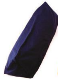
Trekantpude, L Str. 94x24,5x22 cm HMI: 27870 Varenr.: 0305-201-000