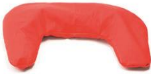
U-formet nakkepude, barn, S Str. 62/109x33x4,5 cm HMI: 65001, Varenr.: 0305-901-000