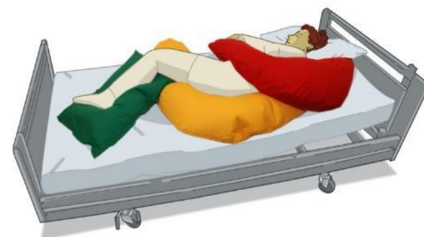
Bananpude S bag om ryggen og under armen. Bananpude L foran kroppen og mellem lårene. Firkantpude L mellem underbenene.

Bomuldsbetrækket er åndbart, vaskbart og anti-bakterielt behandlet. Hygiejnebetrækket er ligeledes vaskbart og mug- og svamperesistent.