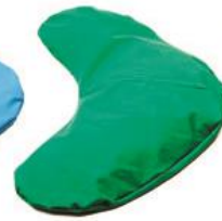
Halvmånepude Str. 79x33x7 cm HMI: 27872 Varenr.: 0305-801-000